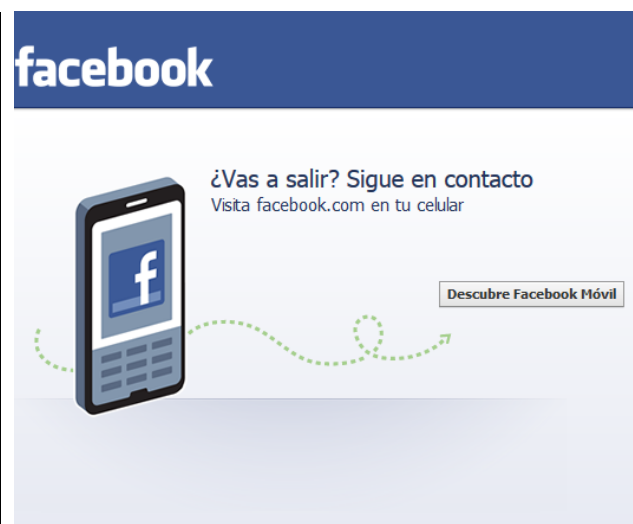
Página Web de Facebook