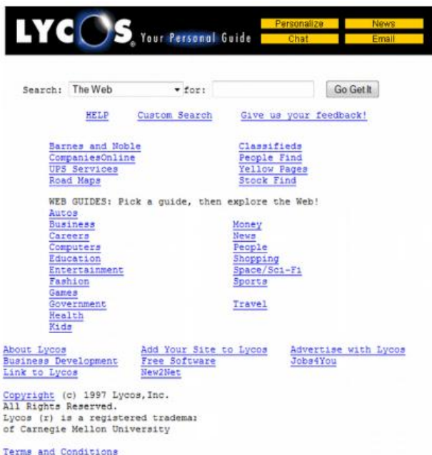
Página Web del portal Lycos a finales de los 90

Y es que el refuerzo en las decisiones de compra se lleva a cabo en gran medida por medio de las redes sociales. Éstas ya se encuentran en un proceso de madurez dentro del mercado con una penetración cercana al 80% por lo que están fuertemente vinculadas a la sociedad. Hay que recordar que hace poco más de 15 años, uno de los portales más importantes, Lycos, no ofrecía ni una centésima parte de lo que se puede encontrar ahora mismo en este medio.